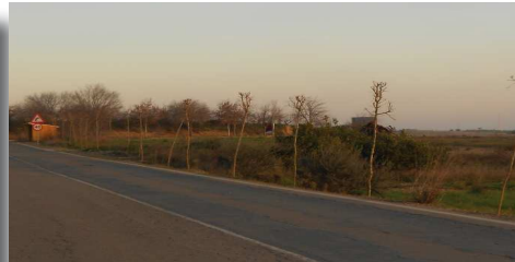
Carretera de circunvalación.