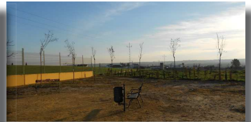
Parque de 'El Candelero'.